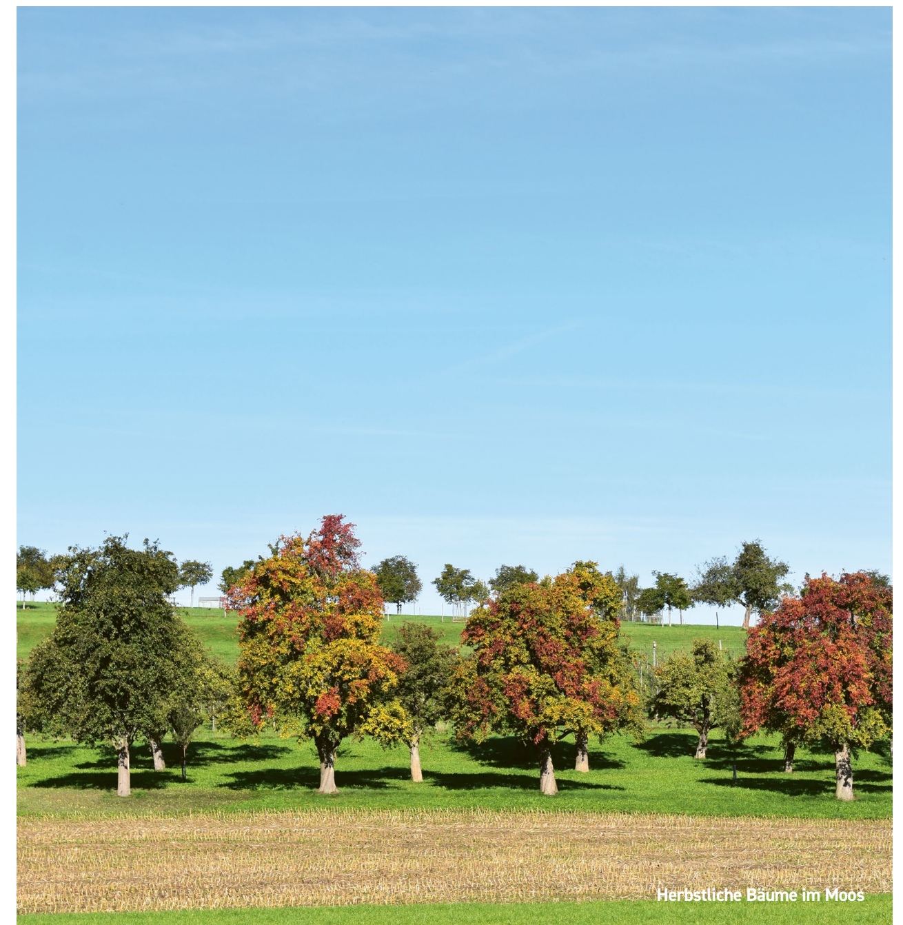
Herbstliche Bäume im Moos