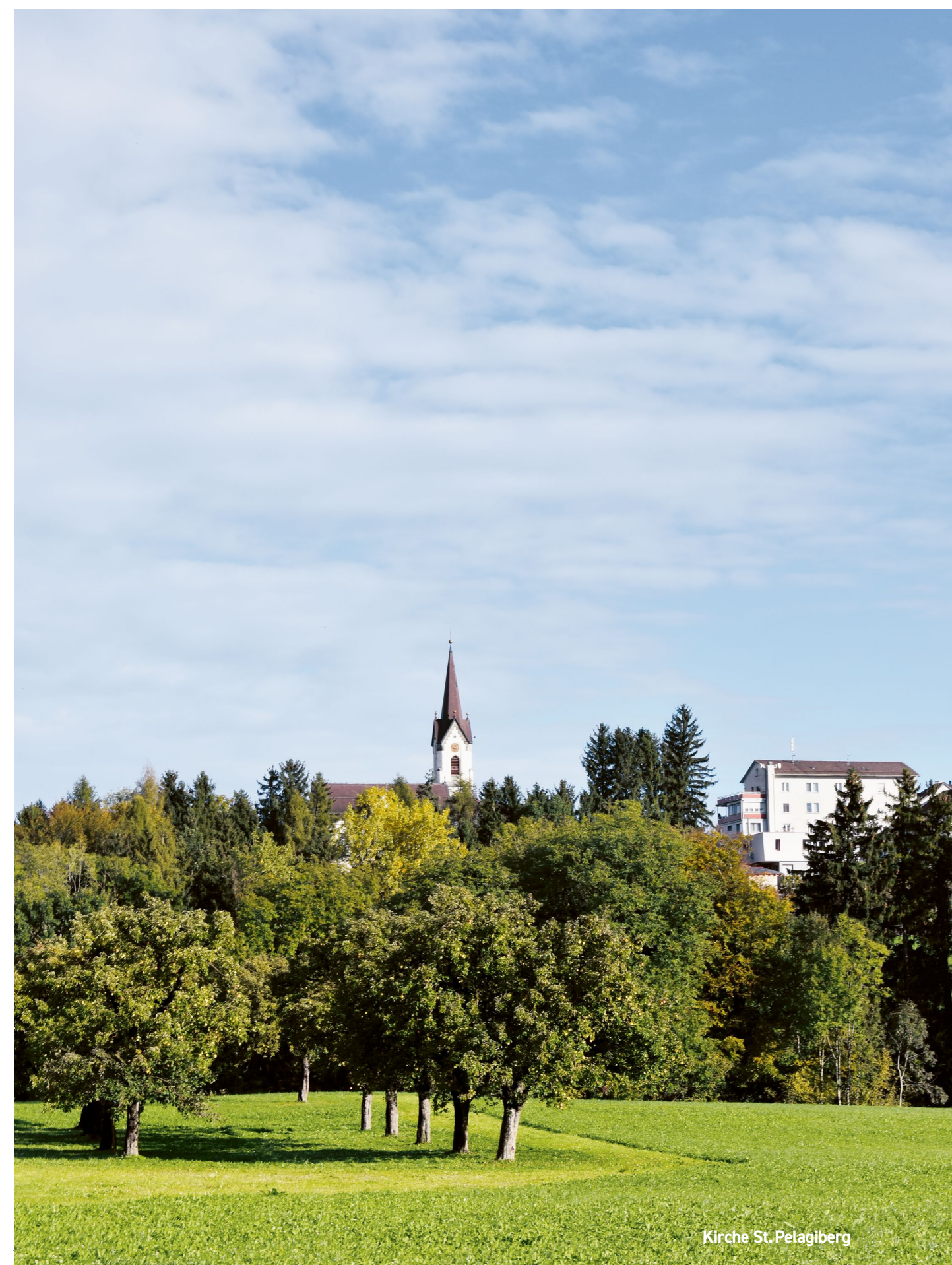
Kirche St. Pelagiberg